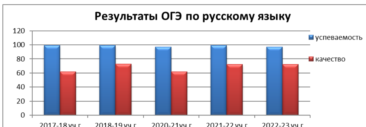
Диаграмма № 2