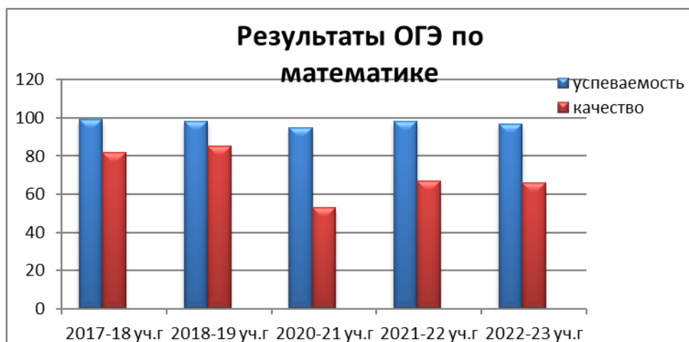
Диаграмма № 1

В связи со стратегическими направлениями социально-экономического развития России «Приоритетной государственной задачей является обеспечение качественного базового уровня математических знаний у всех выпускников школы и это является нашей задачей на 2023-2024 учебный год.